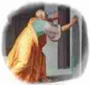
Discepolo e amico di Parmenide