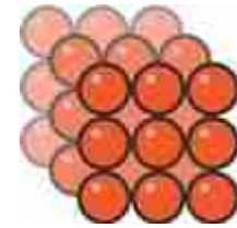
La grandezza delle cose