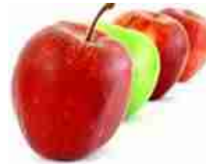
Il numero delle cose molteplici